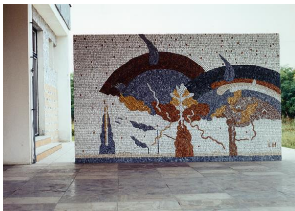
Dom smútku, Bojná