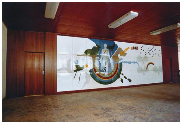
Zdravotné stredisko, Topoľčany