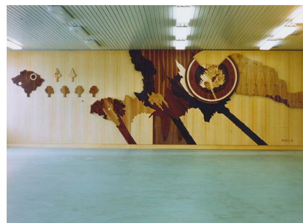
Nábytkáreň, Kráľovský Chlmec