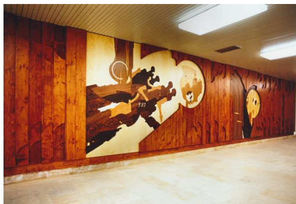
Slovenský ústredný výbor telesnej výchovy, Bratislava